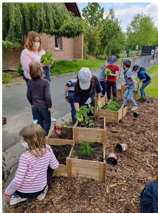
La cour de récréation avec un jardin au fond et notre potager.

L'emplacement idéal de l'école, nous permet de faire régulièrement de belles promenades le long de la Marque.